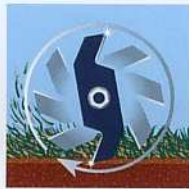
nach 30 Stunden...