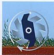
nach 60 Stunden...