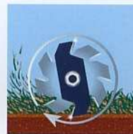
nach 90 Stunden...

Deshalb ist es so wichtig, jetzt wirkungsvoll einzugreifen. Sprühmittel sind hier zwar sehr effizient, um konkurrierende Kräuter und Moose zu vernichten. Die Schicht aus abgestorbenem Moos bleibt jedoch im Rasen stecken und verhindert, dass Licht und Luft bis zu den Wurzeln eindringen können. Außerdem übersäuert der Boden noch weiter. Das Ziel muss sein, diese Schicht mechanisch zu entfernen. Dies ist eine Aufgabe für eine Vertikutiermaschine.