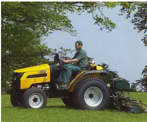
335 HST im Einsatz

Der Kompakt-Traktor 354 ist serienmäßig mit Kabine und Klimaanlage ausgestattet. Mit 54 PS verfügt der 354 jede Menge Power. Alle anfallenden Arbeiten werden schnell und zuverlässig erledigt. Mit 24 Vorwärts- und Rückwärtsgängen steht immer die optimale Geschwindigkeit für jede Einsatzspektrum bereit.