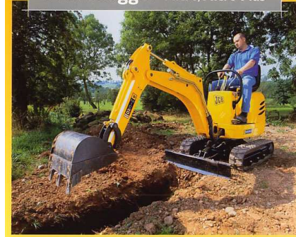
Microbagger Micro/Micro Plus

20 PS, Hydrostat, stärker als ein 1,5 to. Minibagger und genauso wendig wie ein kompakter Radlader, drehbarer Fahrersitz um 180°, geringes Eigengewicht (1.500 kg), geringe Breite (1,47 m), 0,25 m 3 Ladeschaufel, Schütthöhe 1,73 m, Überladehöhe 1,91 m, Heckbagger mit max. 3,11 m Reichweite, 2,54 m Grabtiefe und 14,8 kN Reißkraft. Neu sind der Allradantrieb und die senkrechte Abstützung.