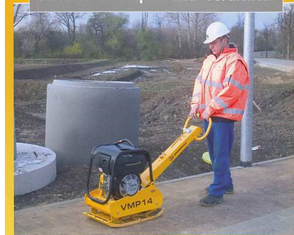
Vibrationsstamper und -verdichter

Zehn mal so viel tragen wie eine normale Schubkarre, das ist das Kennzeichen des Minimuldenkippers Dumpster. Selbst bei einem Ladegewicht v. 400 - 800 kg, garantiert das angetriebene Bandlaufwerk eine optimale Bodenschonung bei einem Bodendruck zwischen 0,17 und 0,19 kg/cm 2 . Ausgestattet mit 9 PS oder 13 PS Motor, verfügt der Dumpster über eine ausgezeichnete Traktion. Auf Wunsch kann der Minimuldenkipper mit einer Selbstladeschaufel und Hochentleerung ausgerüstet werden. Das reduziert den Arbeitsbedarf und steigert die Produktivität.