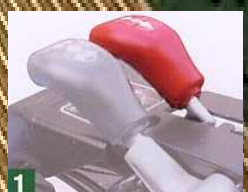
1 Schnellumsteuerung vorwärts/rückwärts am Führungsholm