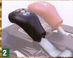
2 Schnellumsteuerung vorwärts/rückwärts Differential mit Sperre am Führungsholm